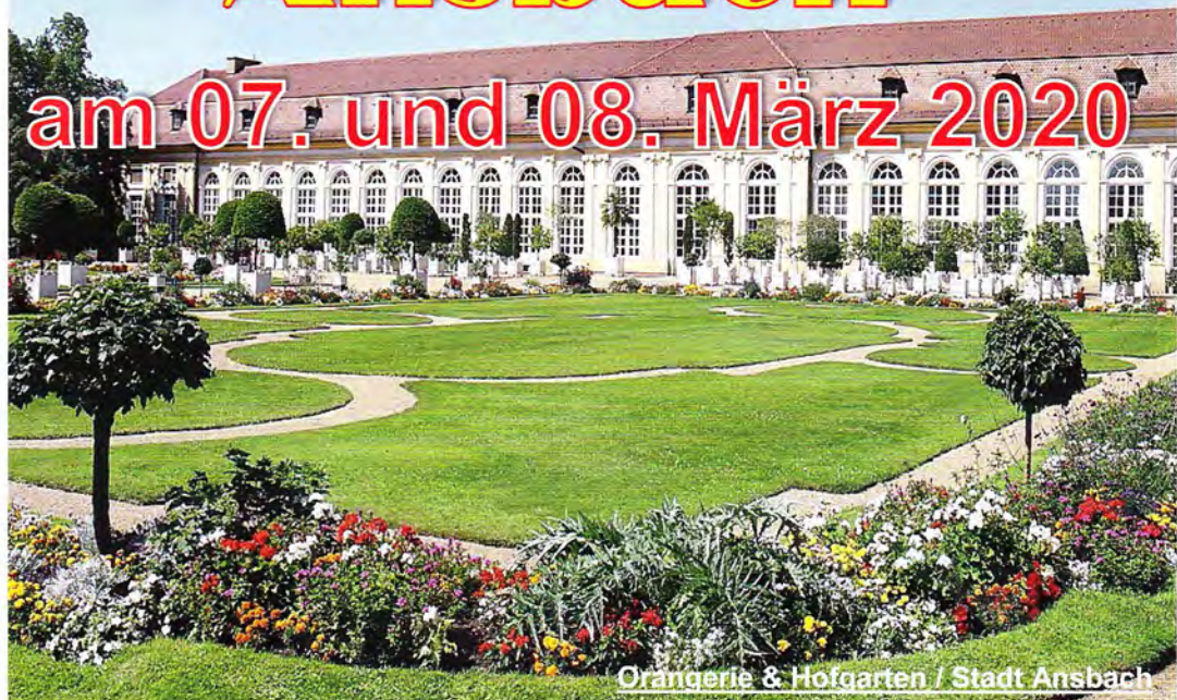
Orangerie & Hofgarten / Stadt Ansbach

Veranstalter: Deutsch-Amerikanischer Wanderclub Ansbach