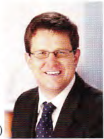
Helmut Bauz Erster Bürgermeister