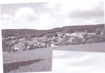
Streckenaussicht des PW in Entenberg

In das Wertungsheft werden jedoch nur tatsächlich gewanderte Kilometer eingetragen.