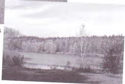
Aussicht auf den Birkensee des PW in Diepersdorf